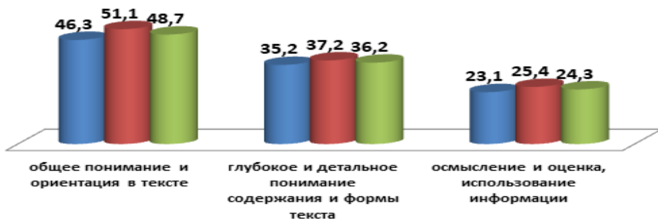
Успешность выполнения заданий по группам умений

■ 6 "А" min % ■ 6 "А" max % ■ 6 "Б" min % ■ 6 "Б" max %